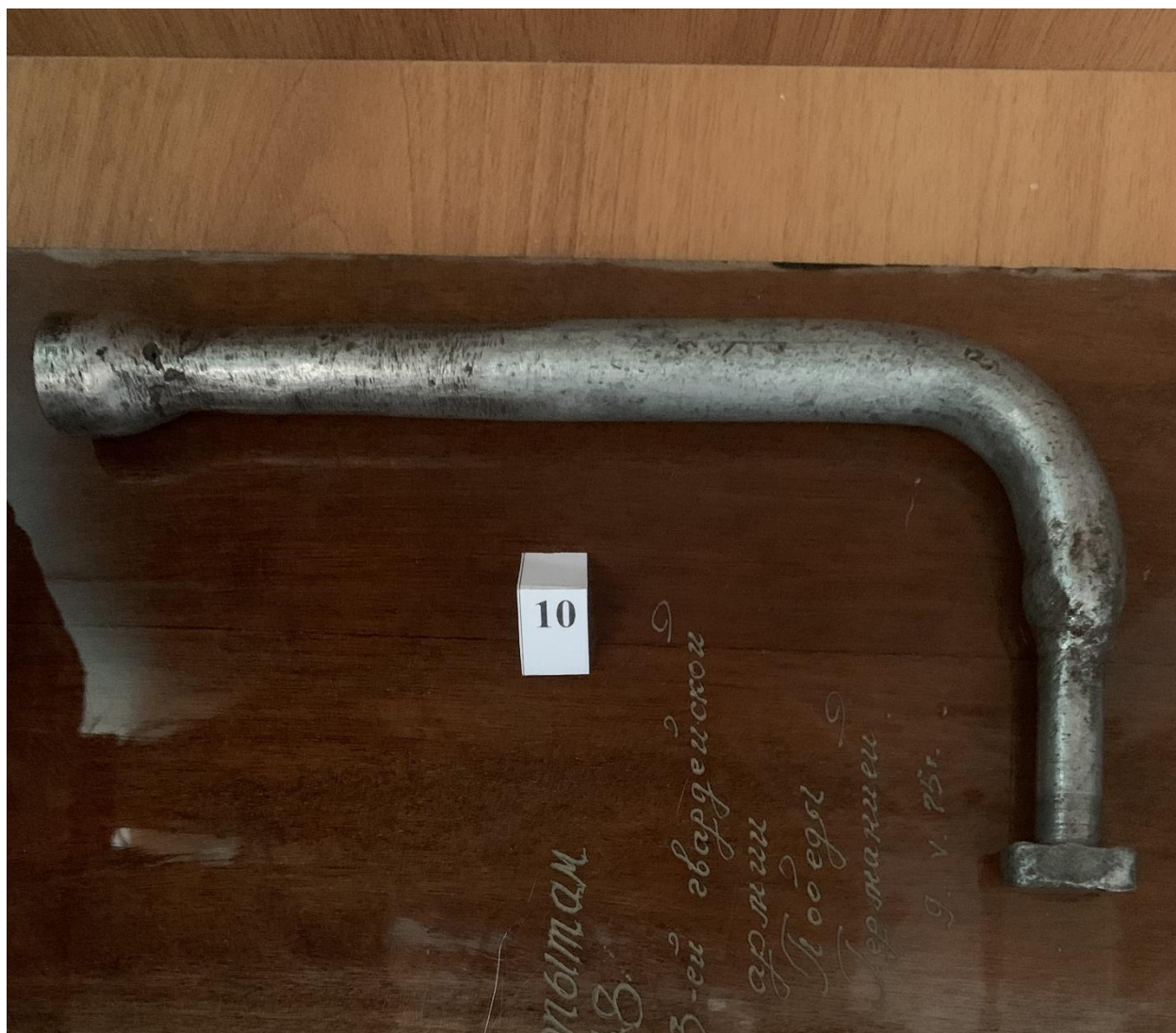
Башенный ключ от танка ИС-3.