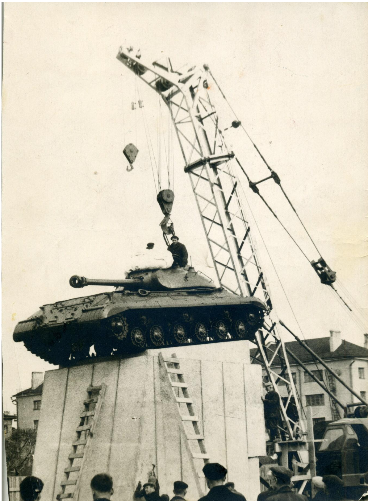
Установка танка на постамент. Май 1965 года.